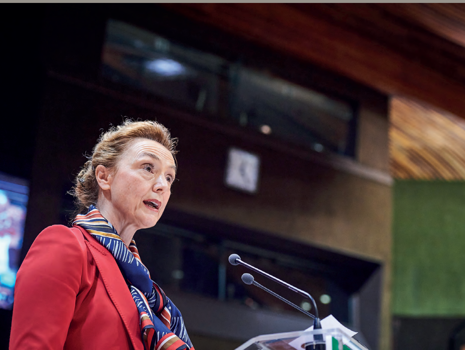
Marija Pejčinović Burić Secrétaire Générale du Conseil de l'Europe